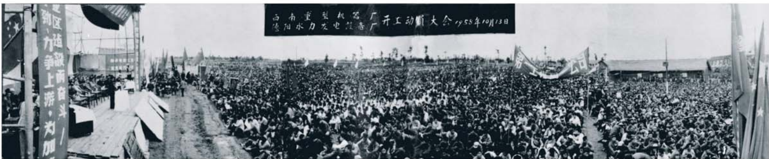
1958年10月13日，东方电气集团第一个子企业东方电机在四川绵阳破土动工，开始了产业报国的创业发展之路。